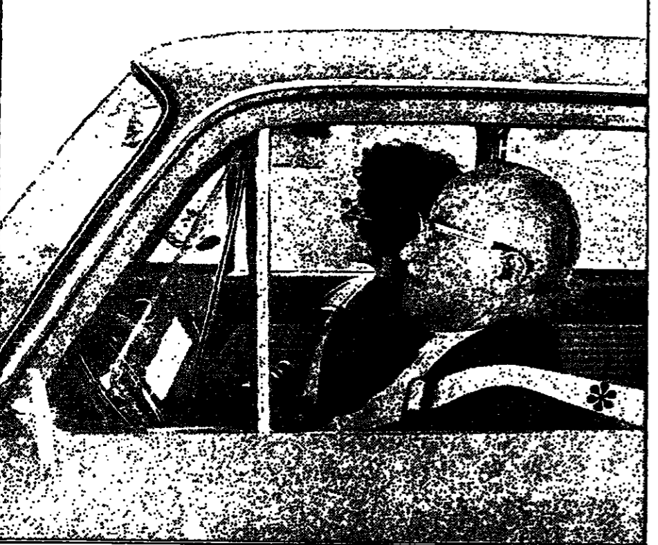
משרד התחבורה • המועצה הלאומית למניעת תאונות

הם יודעים... רק עם החגורה * הנסיעה בטוחה